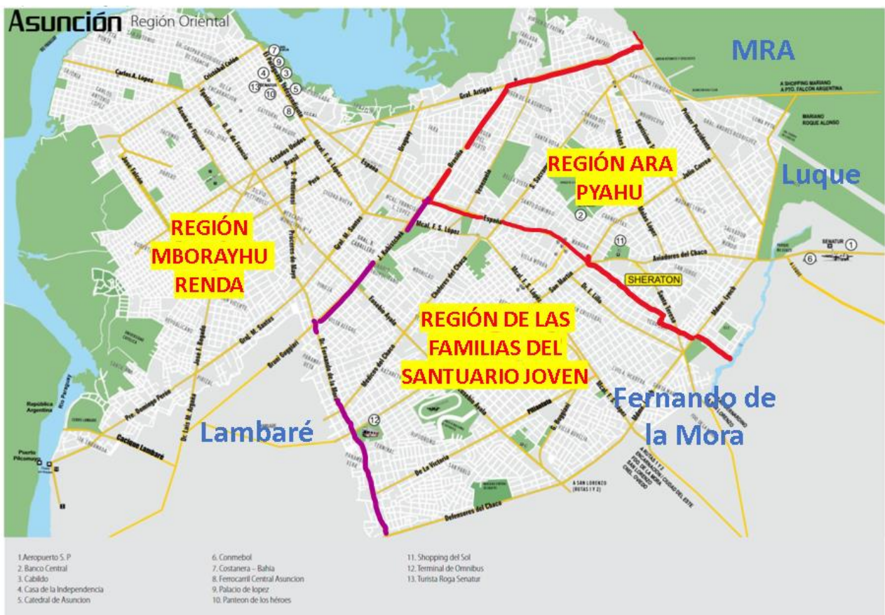
Mapa 2 de los límites de Asunción